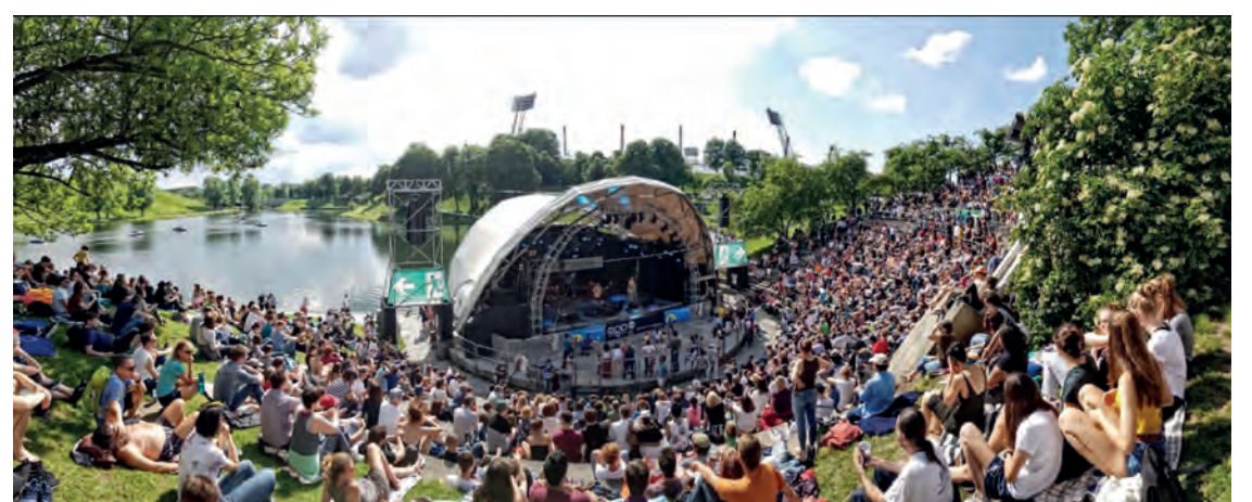
Über 2.000 Menschen beim Theatron-Pfingstfestival München

auf der Bühne und haben 25.000 Euro gewonnen. 2018 endete wunderschön und 2019 begann verheißungsvoll. So sind wir weiter glücklich und gespannt was die Zukunft bringt.