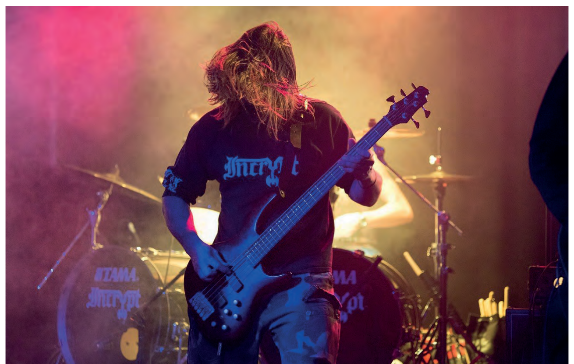
Jeden dritten Dienstag im Monat im Bombig bietet uns die passende Location mit Getränken zu Musikerpreisen :-)

Treffpunkt für Augsburger Bands und Musiker. Zusammen Netzwerken, Austauschen und über Themen die uns beschäftigen, sprechen und diskutieren.