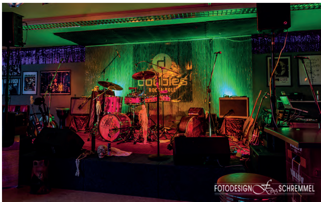
Geile Clubbühne, klasse Laden, mega Publikum!