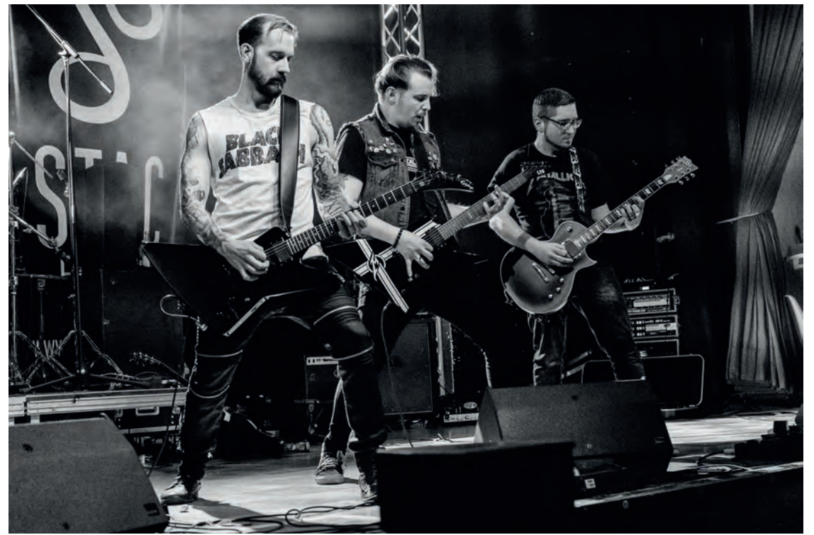
„My Kryptonite“ auf dem STAC-Festival