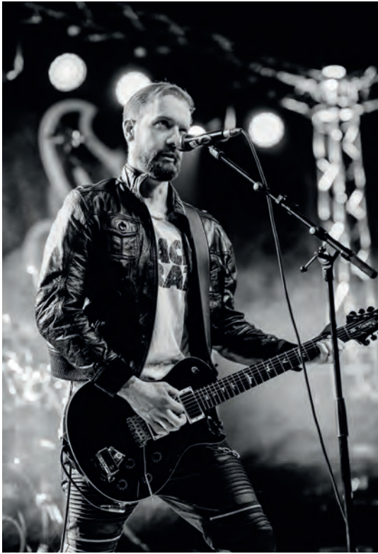
„My Kryptonite“ auf dem STAC-Festival

In der letzten Ausgabe gab es ein paar Tipps für ein gelungenes Bandfoto. Abwechslungsreiches Bildmaterial wird immer benötigt um Social Media Kanäle zu füttern und Veranstalter von Eurer Qualität zu überzeugen.